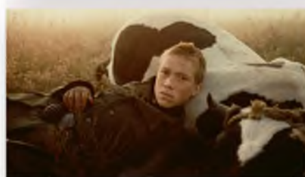
«Иди и смотри» (1985)