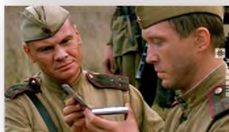
«В августе 44-го» (2001)

Ежегодно 17 декабря в нашей стране отмечается День белорусского кино. Праздник был установлен Указом Президента Республики Беларусь в 1994 году. Дата для него выбрана не случайно. 17 декабря 1924 года вышло постановление Совета народных комиссаров «О кинопроизводстве в БССР». В тот же день при Наркомпросе было создано Государственное управление по делам кинематографии и фотографии «Белгоскино», а в честь праздника сняты первые документальные фильмы о событиях тех лет.