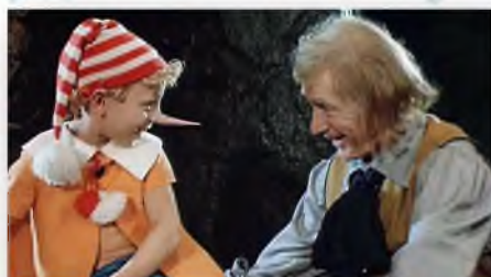
«Приключения Буратино» (1975)