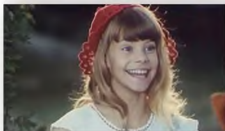
«Про Красную Шапочку» (1977)