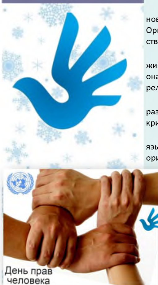
День прав человека

Эта премия присуждается раз в пять лет в годовщину провозглашения Всеобщей декларации прав человека. Впервые она была вручена в 1968 году. Роль этой декларации значительна, велико ее моральное воздействие на развитие прав человека во всем мире, она стала основой для разработки Пактов о правах человека.