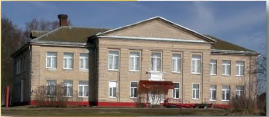
Первый учебный корпус Горецкого педучилища (теперь общежитие №2)