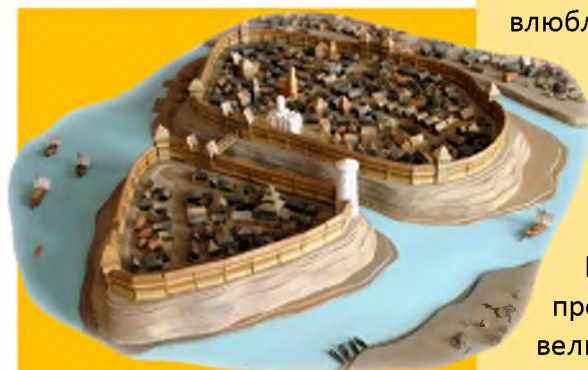
Макет средневекового Турова