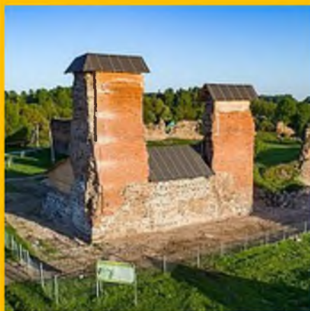
Руины замка в Крево