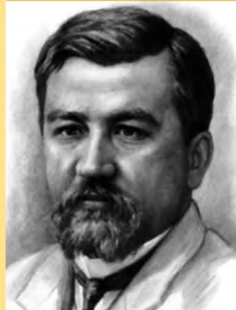
Александр Иванович Куприн (1870 — 1938)