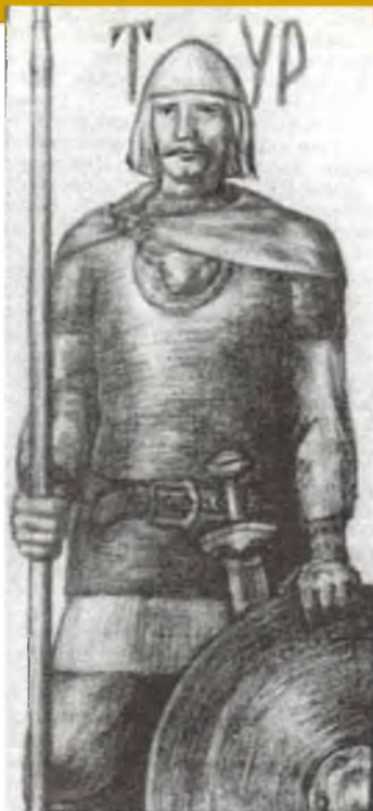
Князь Тур. Худ. Евгений Кулик.