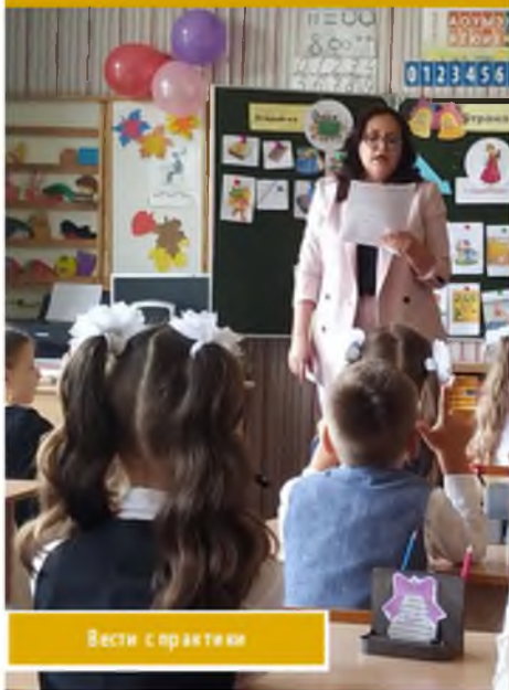
Вести с практики